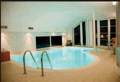
Bazén s přelivem

Při výběru výšky hladiny jsou dvě možnosti. Bazén se skimmerem má hladinu asi 10cm pod okrajem bazénu, zatímco bazén s přelivem má hladinu zároveň s okrajem.